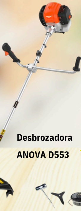
Desbrozadora ANOVA D553