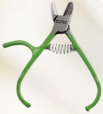
Alicates CITRIC NULES