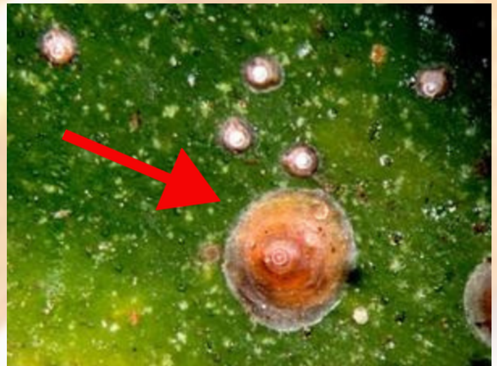
Piojo rojo de california

Suscripciones: Si desea recibir el Boletín electrónicamente, remita un correo con sus datos a: suscripciones@alzicoop.com