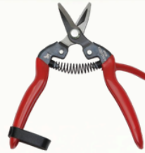
Alicates AGUACATE Pajarita 2006