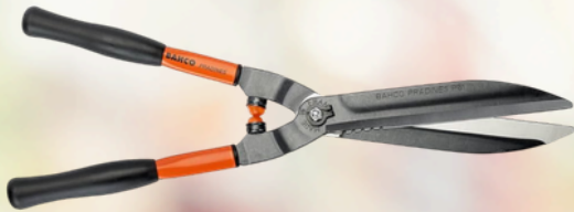
Alicates BAHCO Cortasetos P51-F