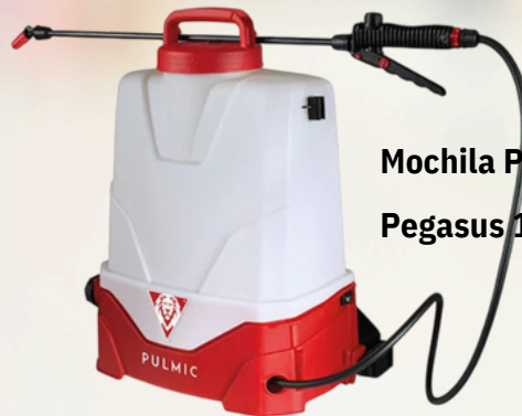
Mochila PULMIC Pegasus 15L