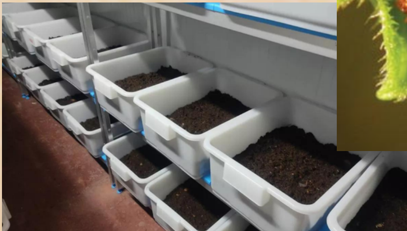
Insectario. Cría de Cryptolaemus Montrouzieri

Suscripciones: Si desea recibir el Boletín electrónicamente, remita un correo con sus datos a: suscripciones@alzicoop.com