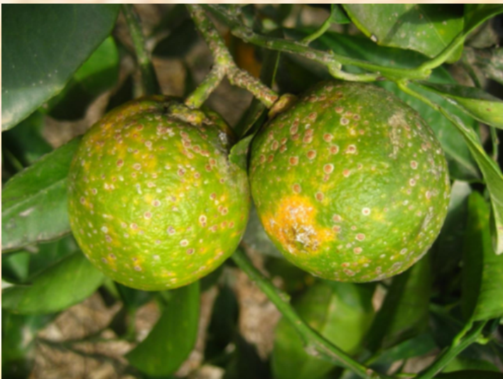
Piojo rojo de california

Este tratamiento va enfocado contra las plagas de diaspinos (piojo rojo de California, piojo gris, serpeteta), cóccidos (caparreta) y mosca blanca , como hemos comentado anteriormente, la detección en las primeras fases de desarrollo de las larvas es primordial, ya que se trata del momento de máxima sensibilidad a la exposición a los tratamientos fitosanitarios y, por tanto, el momento de máxima optimización de los tratamientos realizados.