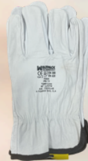
Guantes Piel WOLFPACK